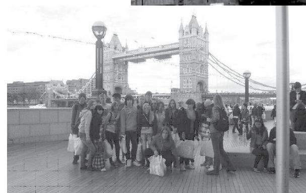
Dvojezičnost u nastavnom procesu